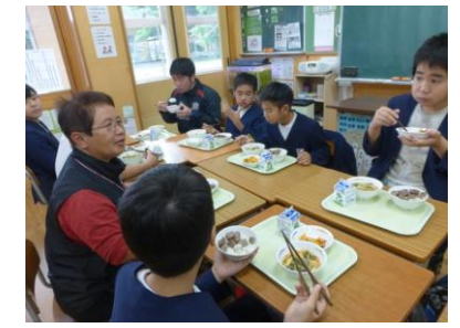
子牛生産農家との交流給食 ↑ 鹿児島ブランド和牛のサイロステーキをいただきました。おいしかった。