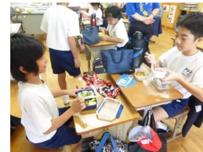
5・6年生自作弁当の日 ↑ 卵、加工品を使ったお弁当作りに挑戦しました。