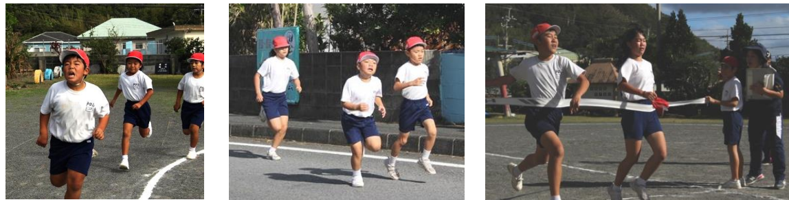
激しいデッドヒートを繰り広げる子どもたち ↑

表面でも紹介されていますが、11月27日(火)、校内の持久走大会が実施されました。天候にも恵まれ好結果が続出でした。