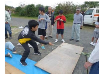
中戸口集落老人クラブと子ども会の交流 ↑ こま、お手玉、風車などで遊んだり、餅つきをしたりして交流しました。子どもたちも楽しそうでした。