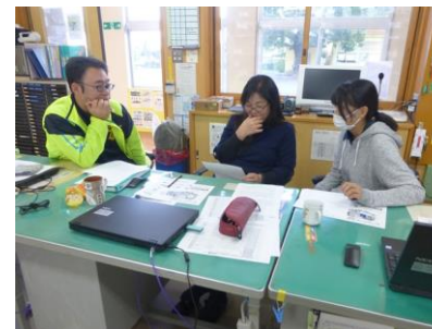
職員不祥事防止研修 ↑ ハラスメント防止に向けて、事例をもとに考えました。