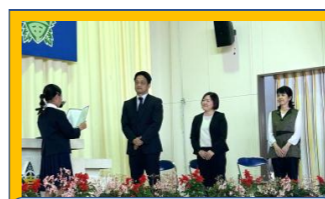
3人の先生方、愛情と花いっぱいの龍郷へようこそ!!

PTA主催の「歓迎会」を下記の日程で行います。詳細については、後日、集落放送でお知らせします。多くの皆様のご参加をお待ちしております。 【歓迎会】 日時：5月23日(土) (18:30~20:30) 場所：龍郷公民館