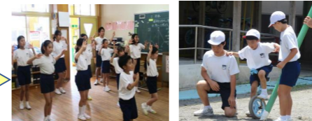
上級生が下級生に優しく教え、リーダーシップを発揮しています。