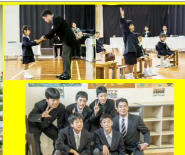
3月に龍郷小を卒業した先輩5人も、中学校の制服を着て、入学式に参加してくれました。ありがとう。