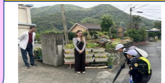
「おはようございます」の元気な声が響きます。あいさつ運動へのご協力ありがとうございました。

PTA主催の「歓迎会」を下記の日程で行います。詳細については、後日、集落放送でお知らせします。多くの皆様のご参加をお待ちしております。 【歓迎会】 日時：5月23日(土) (18:30~20:30) 場所：龍郷公民館