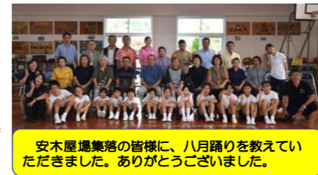
安木屋場集落の皆様にも、八月踊りを教えていただきました。ありがとうございました。

初めての運動会にドキドキの1年生、最後の運動会に向けて燃える6年生...練習期間は短いのですが、教員一体となって運動会を盛り上げるべく頑張っています。登校後、朝は一輪車の練習、昼休みは応援団の練習と、毎日精一杯取り組む姿に、結果だけでなく、本番へ向けての過程の大切さと子供たちの成長を感じています。運動会当日は、多くの皆様にご参加いただき、子供たちと共に楽しみ、子供たちへ熱い声援をよろしくお願いいたします。