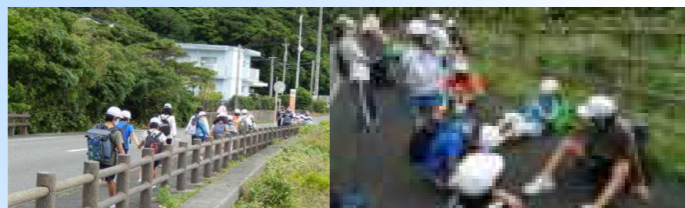
【安木屋場へ出発、いってきます】