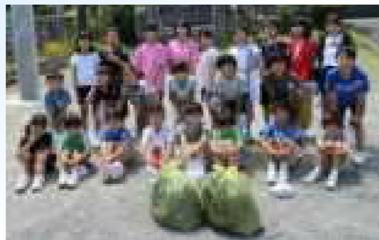
【青少年赤十字のワッペンを付けてボランティア活動】