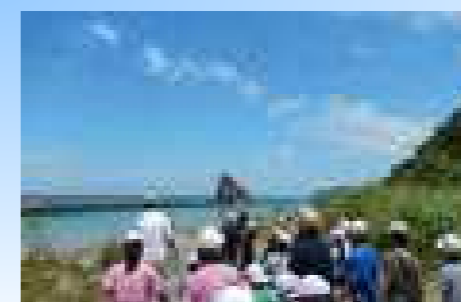
【海の生き物についての説明後、出発】