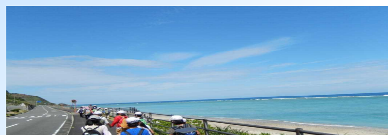
【トンネルを抜けるとこんなにいい天気】