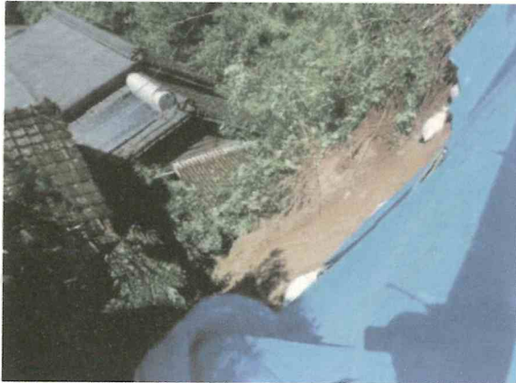
霧島市国分川原地内 毛梨子野地区で発生した がけ崩れ(令和4年9月)