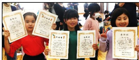
受賞おめでとうございます

3月11日(土)に、りゅうがく館にて、「子ども博物学士講座閉講式」が開催されました。1年生の3人が、調べたことを発表し、表彰されました。