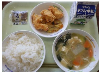
11/9 (木) ♡かまじーの天丼 • みそ汁 • 牛乳