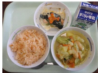
11/7 (火) • トマトライス • ポトフ ♡ホテルアドリアーノの 鮭のクリームソース • 牛乳