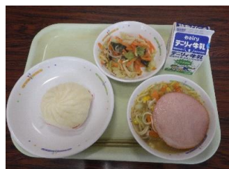
11/10 (金) ♡千と千尋の肉まん ♡ポニョラーメン • 野菜の中華和え • 牛乳