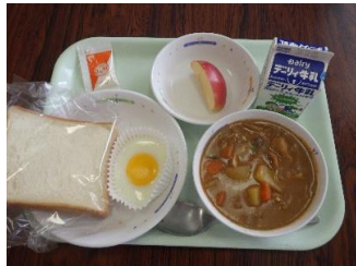
11/8 (水) ♡ラピュタパン ♡シータの作ったシチュー ♡りんご