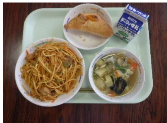
11/6 (月) ♡ルパンのミートスパゲティ • 野菜スープ ♡キキのかぼちゃパイ

ジブリパークができて1周年。行ってみたいけど行けない。でも、ジブリの中で出てくるごはんを食べてみたい!!!そんな思いから、今回、ジブリ給食週間として、給食でジブリで出てくるごはん(ジブリ飯)を再現してみました!今回の給食を実施するにあたり、9月から業者さんをはじめ、色々な方々の協力があって実現した給食でした。