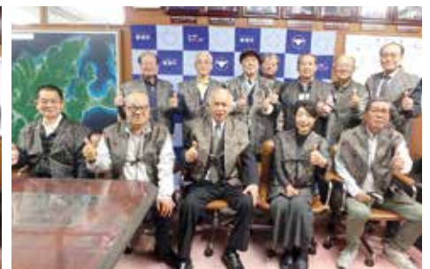
▲大高卒50周年記念同窓会ご一行様