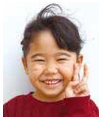
きくの 蘇 菊乃 手広