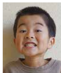
かいち 重枝 香壺 浦