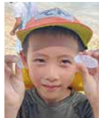
でん 川島 伝 中戸口