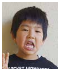
そうよう 小久保 颯洋 円