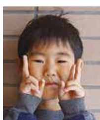
なおま 本門 尚真 中勝