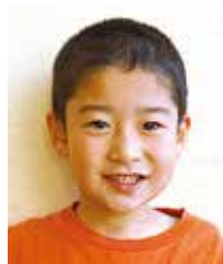
あきよし 川口 晃義 大勝