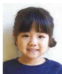
さりな 西 紗里奈 浦