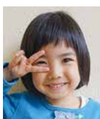
さえ 松元 彩笑 浦