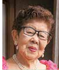
勝冶 糸 大勝