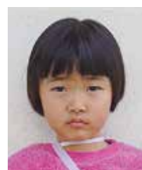
ひまり 萩原 陽葵 浦