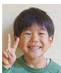
さくと 泉二 朔士 大勝