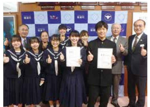
▲県中学校音楽コンクール金賞受賞報告 龍南中ご一行様