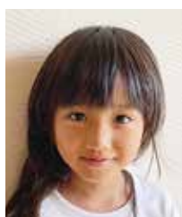
ことば 豊山 琴葉 赤尾木