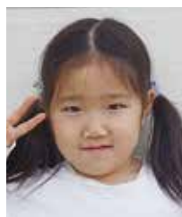
いおり 里井 伊織 中勝