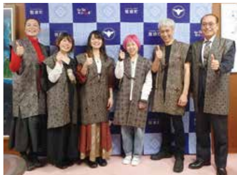
▲奄美観光大使 MAYURA∞三界様ご一行様