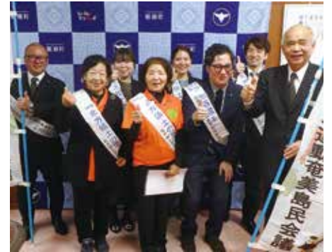
▲北方領土返還要求運動奄美島民会議 ご一行様