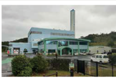
奄美市にある名瀬クリーンセンター

令和4年度において可燃ごみ、不燃ごみ、粗大ごみの搬入は5市町村で2万2千トン、処分手数料は4406万円、本町は1千9百32トンで処分手数料は190万円、対前年度比0.3%の増となっている。