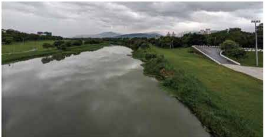
西郷菊次郎が宜蘭庁長時に整備した宜蘭川堤防(西郷堤防)