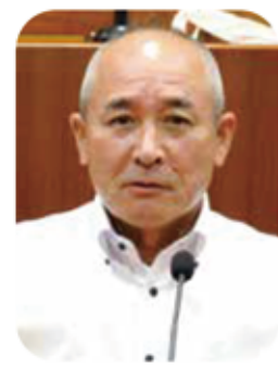
平岡 馨 議員