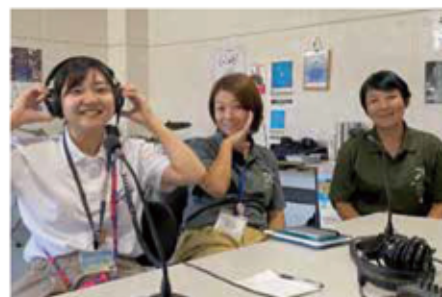
多方面で活躍している協力隊員