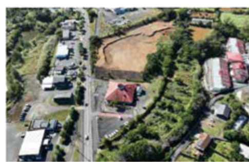
島育ち産業館周辺の商業ゾーン

の整備計画を注視しながら、どのような施設がどこに必要なのか検討している状況である。