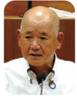
長谷場 洋一郎 議員