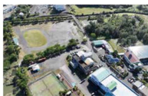
現在の社会体育施設の現況

若手職員7名と教育委員、会事務局3名の計10名で数回会議を実施し、保健福祉センターや島育ち産業館等優先すべき施設があり、そ