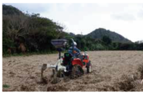
公社による耕作放棄地への植え付け作業状況