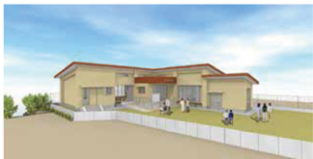
停電時に備えた発電機を導入予定の安木屋場公民館 (完成イメージ)