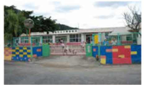
築50年が経過した大勝保育所