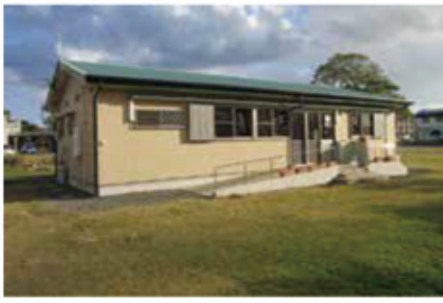
赤徳放課後児童クラブ

認可保育所として、大勝・赤徳保育所、認可外として秋名・龍瀬・戸口へき地保育所、龍瀬・大勝・赤徳放課後児童クラブの合計8つの施設を管理している。