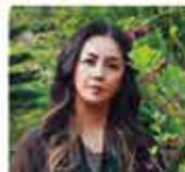
元 ちとせ(唄) hajime chitose