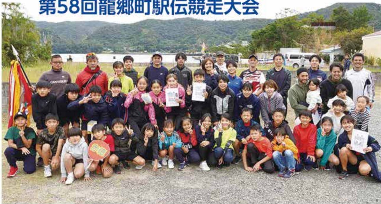
▲大会新記録で優勝した赤徳選手団