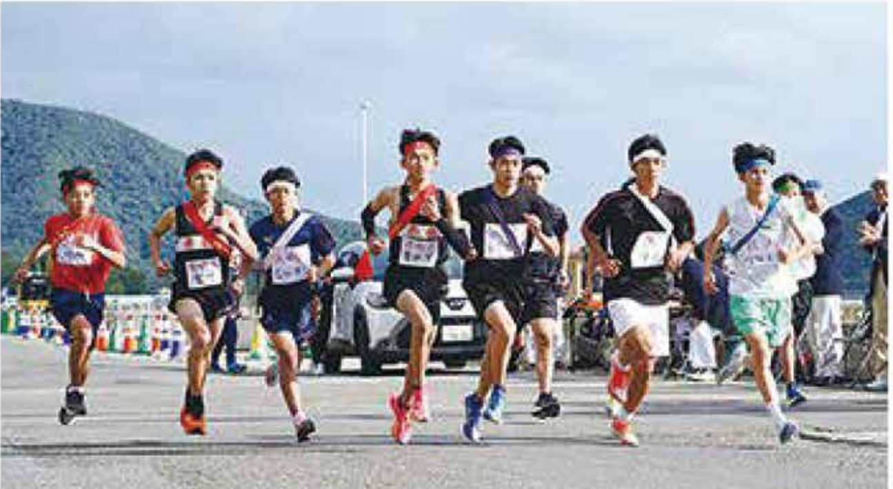
▲中学男子からスタート