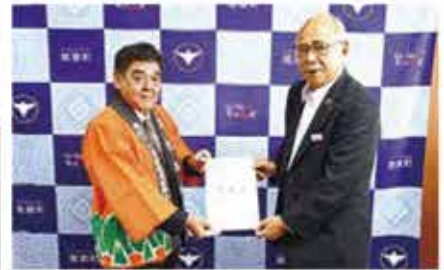
▲鹿児島県木材利用推進運動協議会様