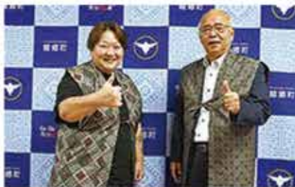
▲長与千種様(女子プロレスラー)