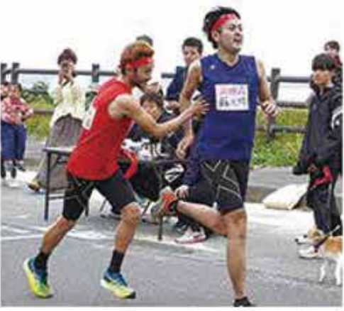
▲兄から弟へのタスキリレーも（赤徳）