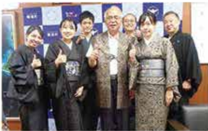
▲一般財団法人きものの森様ご一行