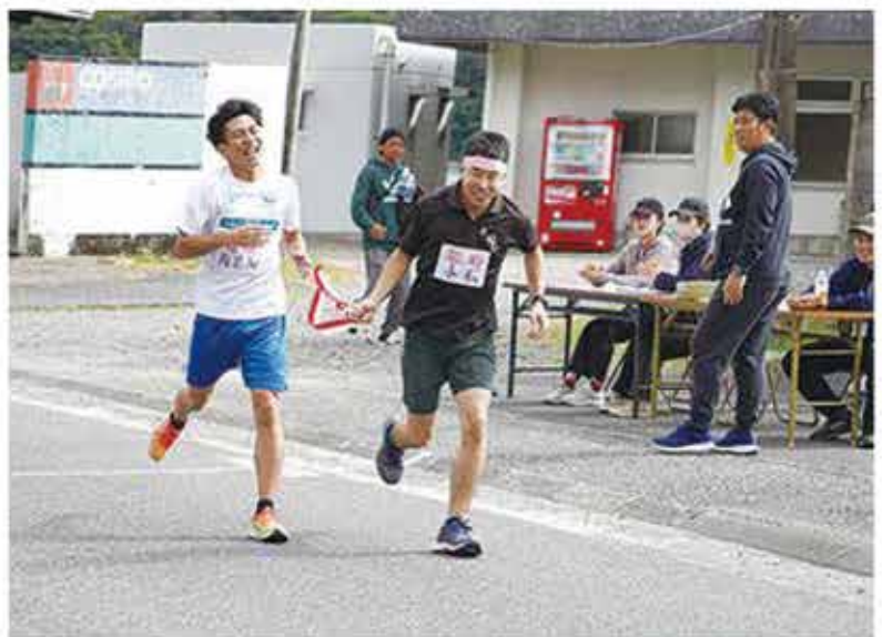
▲躍進賞を獲得した龍郷