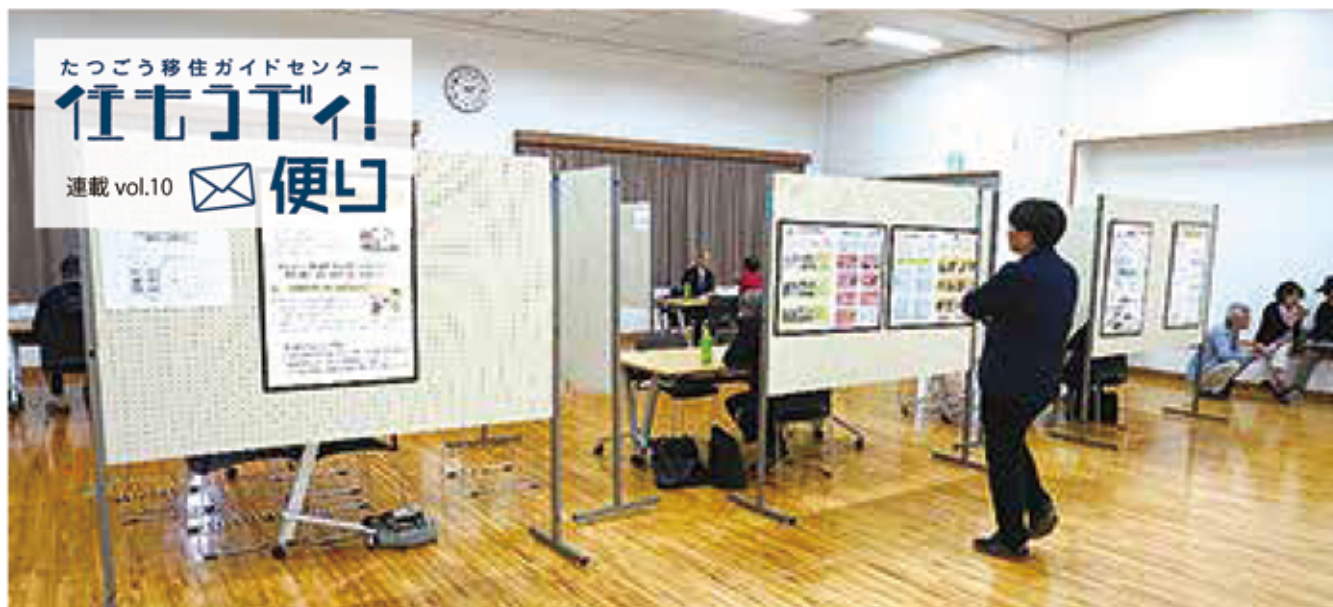
空き家バンクの活動を紹介する展示パネルと個別相談ブース