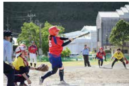
全試合で好調だった強力打線

各種スポーツの群島一を決める第64回大島地区大会(通称・郡体)が7月8日から各地で開催されました。龍郷町中央グラウンドではソフトボール女子競技があり、地元開催の龍郷が22年ぶりに頂点に立ちました。 龍郷は予選2試合を連勝で突破し、決勝戦では大会20連覇中の奄美市と対戦。先制を許すも打線が繋がり逆転、好守も連発するなど試合を優位に進め、12対4で栄冠を手に入れました。(他競技結果は次号で紹介します。)