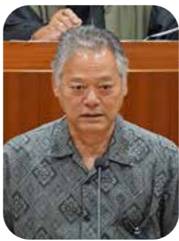
田畑 浩 議員

今年度も国の電力・ガス・食料品等価格高騰重点支援交付金による支援を予定しておりますが、あくまで応急的な支援でございますので、今後の所得向上に向けて、町内の経済活動によって生み出されるモノやサービスへの付加価値をいかに