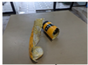
爆発したスプレー缶

商品に表示されているメーカーにお問い合わせください。メーカー名が分からない場合は以下にお問い合わせください。 一般社団法人日本エアゾール協会 電話番号:03-5207-9850 ホームページ: https://www.aij.or.jp/