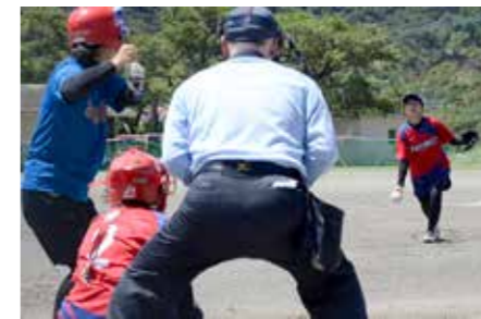
投手2枚看板で勝ち抜きました