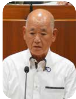
長谷場 洋一郎 議員