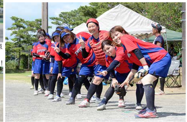
決勝戦プレイボール直前 最高の雰囲気