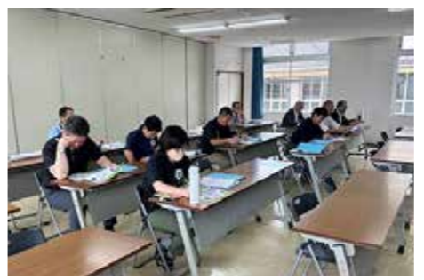
プロジェクト研修

既存の公共施設等総合管理委員会、公共施設等ワーキンググループを除く13のプロジェクトチームを新たに設置いたしました。近年の社会情勢の変化に伴う新たな行政課題に対し、柔軟かつ迅速に対応する事を目的としております。各施策について一担当課のみが計画を策定していましたが、プロジェクトチームで協議することにより、全庁的な合意形成が図られ、組織としての情報共有ができるほか、目的が明確であることから、メンバーのモチベーションが高まるといったメリットがございます。