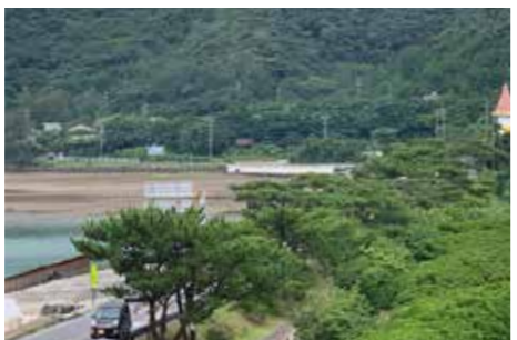
国道 58 号「浦の橋立」

役場から浜千鳥館までの国道58号は、左手に龍郷湾右手に松並木が一直線に続く景色がみられる風光明媚な場所として「浦の橋立」と呼ばれ、町内外の方々から親しまれております。