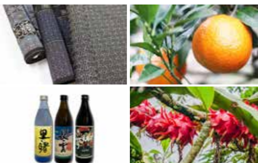
ふるさと納税の返礼品(一例)

増やしていくのか、農業の各種生産部会や商工会、ふるさと納税返礼品の出品事業者等と知恵を絞って参りたいと考えております。