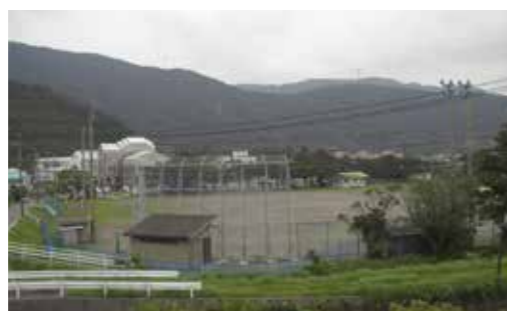
町中央グラウンド

答（教育長） 現グラウンドをこれまで同様に多目的施設として管理するのか、現グラウンドを一競技の施設とするのか、他の競技の施設は別の場所