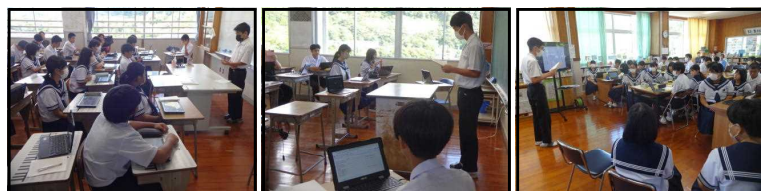
【1年生】 【2年生】 【3年生】