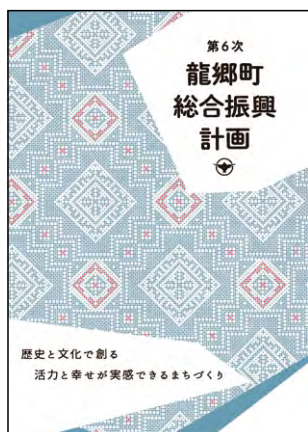
第6次龍郷町総合振興計画

また、今後の課題では、町民アンケートで満足度が低かった「雇用創出」「道路・公共交通」「住宅の整備」などが挙げられ、特に住宅対策は、「住みたいのに家がない」「町内事業所で雇用する従業員の住居を探している」という声も聞きますので、雇用対策という側面からも、住宅確保については、官民連携の取り組みも必要がある課題だと考えている。