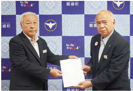
中学校在り方検討委員会

答(教育長) 町長の方針が示された。地域、校区での丁寧な説明を行っていく。今後は校名・校歌・校