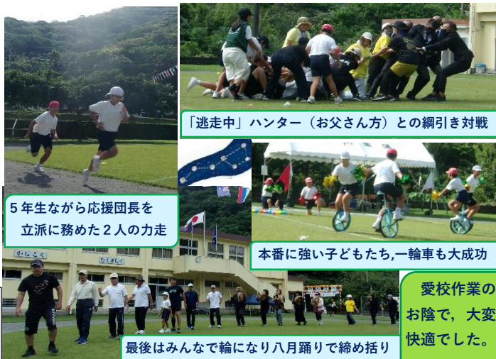
「逃走中」ハンター（お父さん方）との綱引き対戦