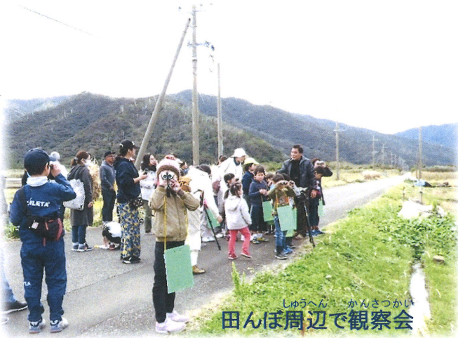
田んぼ周辺で観察会

今回のタツコンホールは瀬留集落にある国指定登録有形文化財「瀬留カトリック教会」でした。