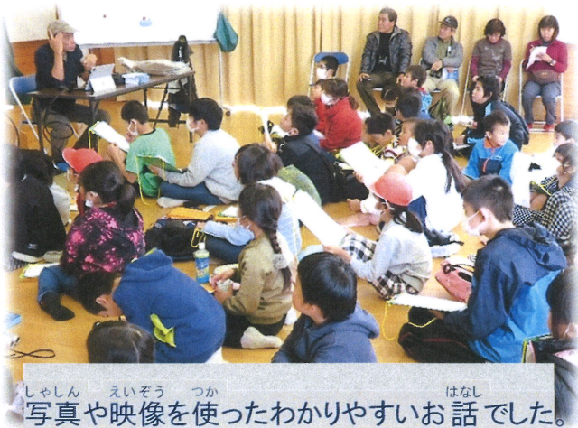
写真や映像を使ったわかりやすいお話でした。