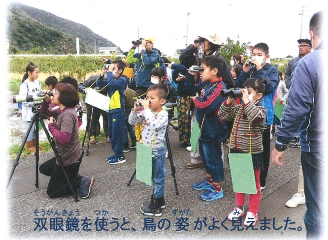
双眼鏡を使うと、鳥の姿がよく見えました。